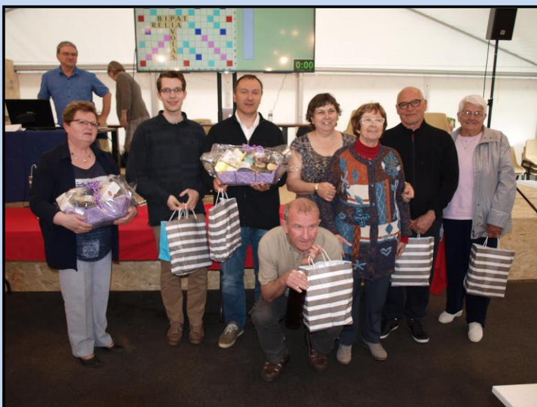
Lauréats Championnat de l'Aveyron